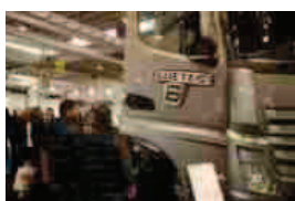
Accordo Fiera Milano e Verona Fiere per Transpotec e SaMoTer

Milano, 19 nov. (askanews) - Accordo di collaborazione tra Fiera Milano e Veronafiere per lo svolgimento "sinergico e contemporaneo" della prossima edizione delle rispettive manifestazioni Transpotec Logitec e SaMoTer , che si terranno dal 22 al 25 febbraio 2017 nel quartiere espositivo veronese.