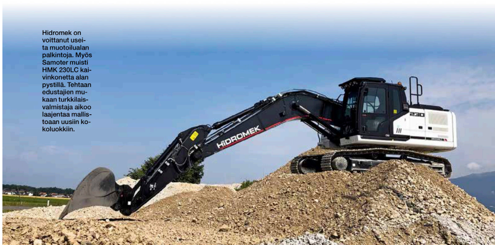
Hidromek on voittanut useita muotoilualan palkintoja. Myös Samoter muisti HMK 230LC käivinkonetta alan pystillä. Tehtaan edustajien mukaan turkkilaisvalmistaja aikoo laajentaa mallistoaan uusiin kokoluokkiin.

Wacker Neusonin aiemmin julkaistu akkukäyttöinen EZ17E-käivinkone on päässyt sarjatuotantoon, ja palkittiin omassa sarjassaan innovaatiopalkinnolla. Ensi vuoden aikana markkinoille saapuu myös hieman suurempi EZ26E, jonka työpaino on noin