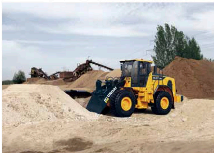
Hyundai esittelee A-sarjan kuormaimiaan. Mallimerkinnot ovat HL940A, HL955A ja HL960A. Työpainot ovat 13,4–19 tonnia. A-sarjassa on tavoiteltu tehokkuutta työmukavuutta unohtamatta.