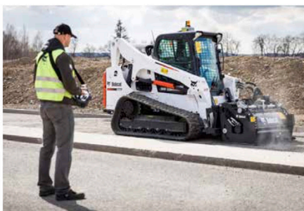
Uuden erityisesti materiaalinkäsittelyyn suunnatun kurottajansa lisäksi Bobcat demonstroi liukuohjattujen kuormainten jälkiasennettava kauko-ohjausjärjestelmää.

Samoteriin kohdistuva kiinnostus on ymmärrettävää, sillä monet tulevista näytteilleasettajista raportoivat vuoden 2019 olleen erittäin