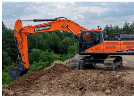
Doosanin seiskasarja laajenee ylöspäin DX350LC:n muodossa. Suomeen on jo myyty hieman pienempi DX300-malli. Viimeisimmät päästö määräykset täytetään ilman EGR-venttiiliä.

alueella järjestetään myös erilliset Asphaltica- ja ICCX-näyttelyt, jotka keskittyvät asfaltointiin ja betoniin.