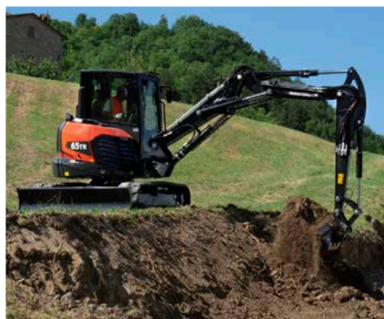
Italialainen Eurocomach uudistaa noin kuuden tonnin kokoluokan kaivinkoneita. Samoterissa esitellään 60ZT ja 65TR. Ensimmäises- sä on monopuomi ja jälkimmäisessä kolmosainen pääpuomi.