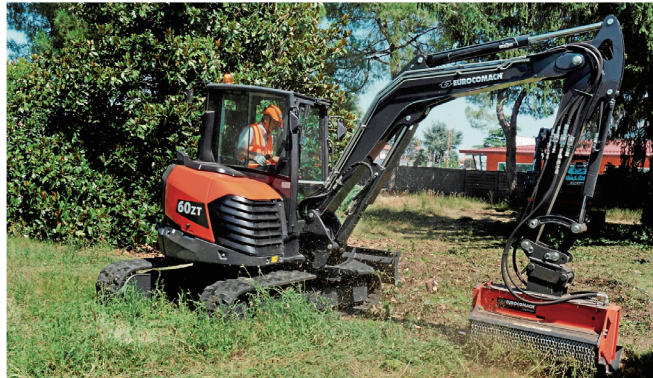
KOMMER NÅ: Eurocomach lanserer nye minigravere i 6-tonnssklassen.

Eurocomach har videre planer om oppgradering av maskinene i 8-10 tonn, og nye modeller i 4,5-5 tonnklassen. På Samoter vil produsenten vise prototypen på en 4-tonner. Som på 6-tonneren har denne Steg V-motor (med dieselpartikkelfilter), og det er ventet at maskinen er på markedet mot slutten av 2020.