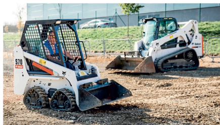
SPEIELL: Ser ut som hjulgående, men har fire belter.