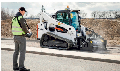
FJERNSTYRING: Løsning for å fjernstyre kompaktlasterne.