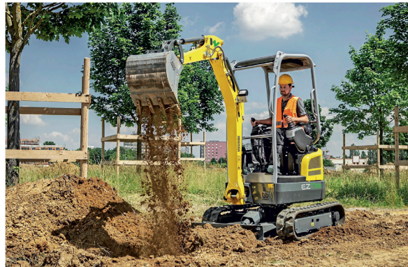
HELELEKTRISK: Wacker Neuson EZ17e (1,7 tonn) kan kjøres på batteri, med kabel og lades mens den kjøres på kabel.