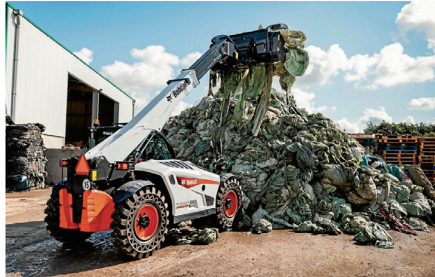
AVFALL: Ny teleskoplaster spesielt beregnet for avfallshåndtering.