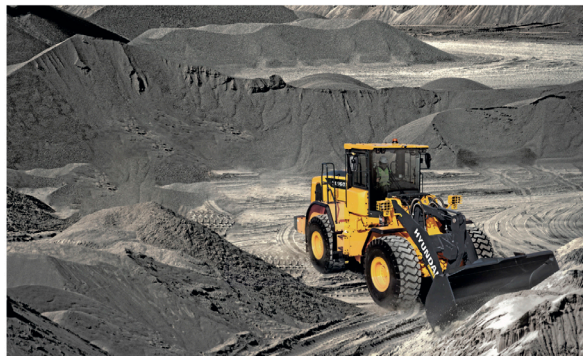
FIKK PRIS: Hjullasteren HL960A på snaut 20 tonn har fått en innovasjonspris i forkant av Samoter.

Tre av nyhetene er hjullastere: HL940A (14 tonn), HL955A (15 tonn) og HL960A (19 tonn). Maskinene er utstyrt med Cummins Steg V-motorer med effektuttak fra 157 hk til 218 hk. I tillegg lanserer den koreanske produsenten en HX300ANL beltegraver med smalt belteunderstell, spesielt utviklet for det italienske