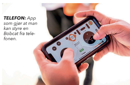
TELEFON: App som gjør at man kan styre en Bobcat fra telefonen.

Serien leveres med Steg V-motorer på 100 hk eller 130 hk, og med løftekapasitet fra 3,4 tonn til 4,3 tonn og løftehøyder fra 6,5 meter til 8 meter.