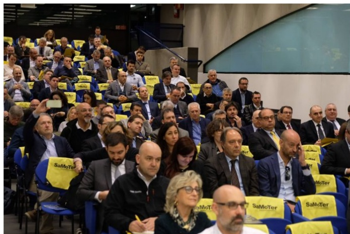
SamoterDAY marzo 2019

f Condividi su Facebook Tweet su Twitter G+ Mi piace 25 Tweet