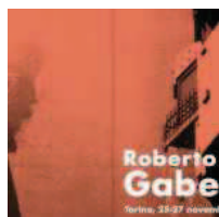
L'IMPEGNO DELLA TRADIZIONE. GIORNATE DI STUDIO IN ONORE DI ROBERTO GABETTI Roberto Gabetti (29 novembre 1925 - 5 dicembre 2000), laureato e docente del Politecnico di Torino...