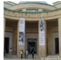
Bioarchitettura: architettura vivente, come progettare la normalità Bari, 29 giugno 2012 - Un convegno internazionale e una mostra itinerante che ha già toccato le citt...