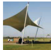
Analisi del territorio e perequazione urbanistica Nella sala convegni di Confindustria Bari l'incontro di approfondimento sulle opportunità della pere...