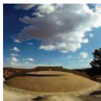
TRIBUTO A PAOLO SOLERI, L'IDEOLOGO DELL'ARCOLOGIA Martedì 24 settembre il Salone internazionale della Ceramica per l'Architettura e dell'Arredobagno d...