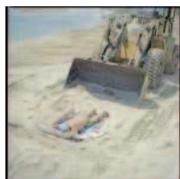
L'architettura e il paesaggio nella fotografia pugliese Dieci motivi per scegliere LAB. Una riflessione sulla giovane fotografia di ricerca. La most...