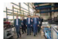
Enrico Zanetti, Sottosegretario al Ministero dell'Economia e delle Finanze, al convegno promosso da ... Si è svolto il 24 giugno, presso l'Università LUMSA di Roma, il convegno a tema "Patent Box italiana..."