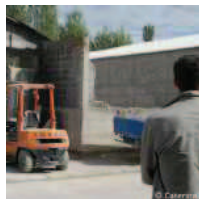
Costruzioni industrializzate: quale futuro? È Bologna la sede del prossimo Congresso Nazionale ASSOBETON che si terrà il 15 giugno e avrà un osp...