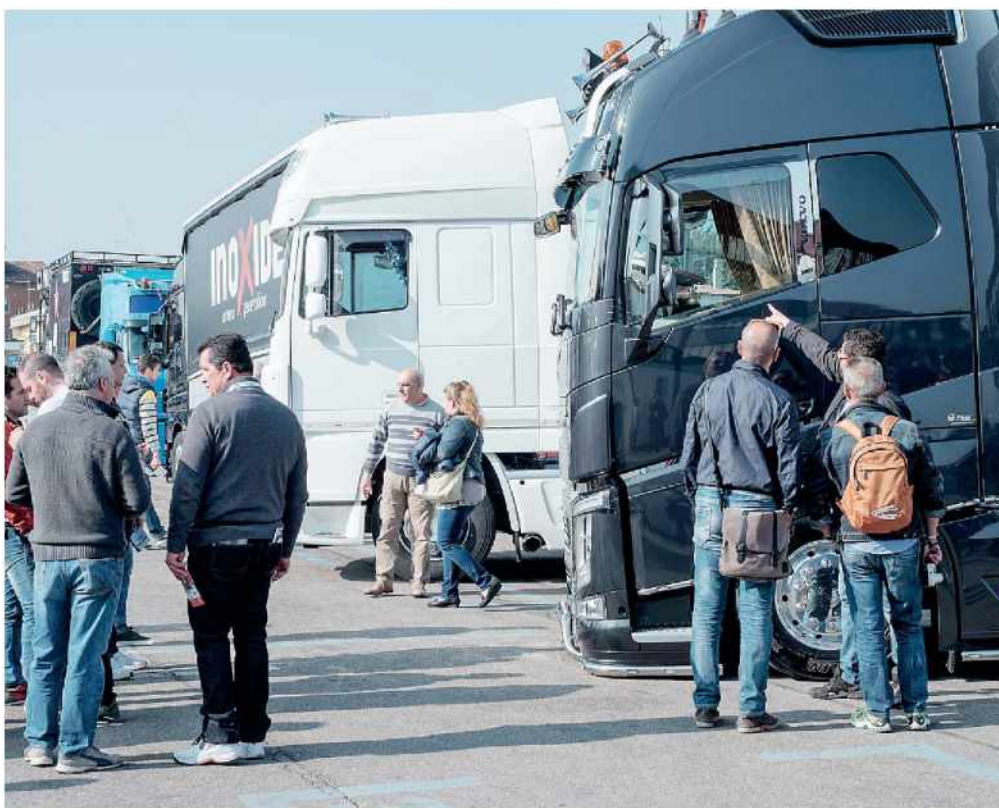
Più spazio espositivo. A Verona Transpotec Logitec presenterà più di 300 aziende